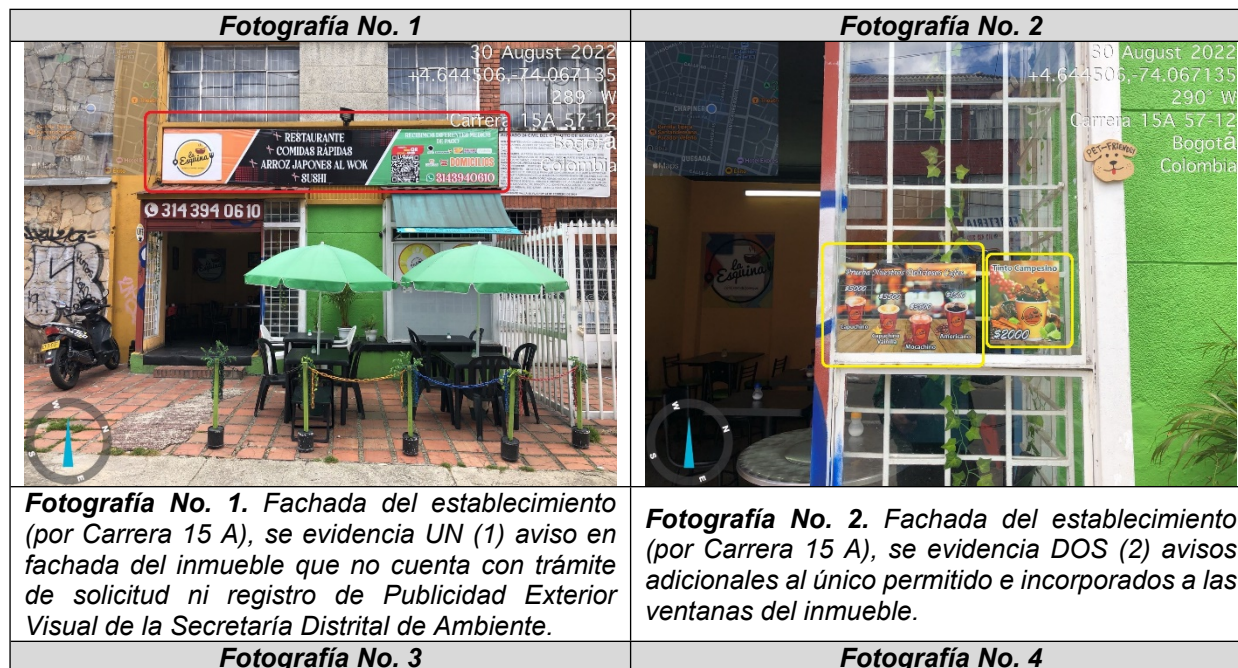
Tabla 3. Registro fotográfico.

Valoración técnica y conductas generales evidenciadas (Ver Anexo No. 1. Acta de Visita No. 204786).