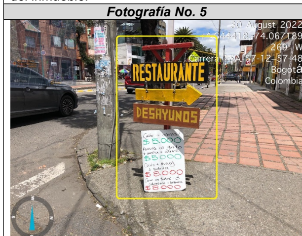
Fotografía No. 5. (por esquina Avenida Calle 57 - Carrera 15 A), se evidencia UN (1) elemento no regulado instalado en área que constituye espacio público.