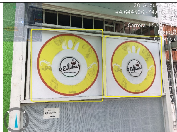
Fotografía No. 4. Fachada del establecimiento (por Carrera 15 A), se evidencia DOS (2) avisos adicionales al único permitido e incorporados a las ventanas del inmueble.