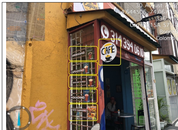
Fotografía No. 3. Fachada del establecimiento (por Carrera 15 A), se evidencia CINCO (5) avisos adicionales al único permitido e incorporados a las ventanas del inmueble, además se evidencia UN (1) aviso adicional saliente y volado de la fachada del inmueble.